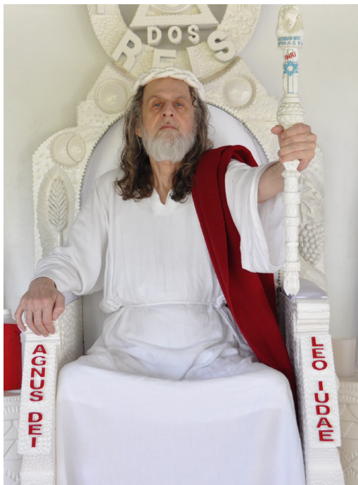
INRI no Altar da Santíssima Trindade da SOUST em Brasília (Nova Jerusalém - Apocalipse c.21)

pensamentos em relação ao Filho do Homem, como ele mesmo advertiu: “Não julgueis para que não sejais julgados. Pois, segundo o juízo com que julgardes, sereis julgados; e com a medida com que tiverdes medido, também vós sereis medidos” (Mateus c.7 v.1-2).