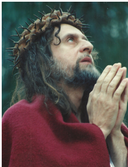
INRI invocando o PAI enquanto falava ao povo na Rua das Flores, centro de Curitiba / PR (1993).

“Em verdade vos digo que não beberei mais deste fruto da videira até aquele dia, em que o beberei de novo convosco no Reino de DEUS” (Marcos c.14 v.25).