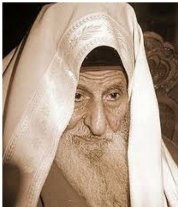
Rabino Yitzhak Kaduri

Logo antes de morrer, em janeiro de 2006, um dos mais proeminentes rabinos de Israel, Yitzhak Kaduri, escreveu o nome do Messias em uma pequena nota. Seu último desejo foi que se esperasse um ano após sua morte para revelar o que escreveu. Na nota, o rabino revela que Jesus é o Messias, provocando reações adversas no meio judaico. Alguns meses antes de morrer aos 108 anos, Kaduri surpreendeu seus seguidores quando lhes falou que conheceu o Messias.